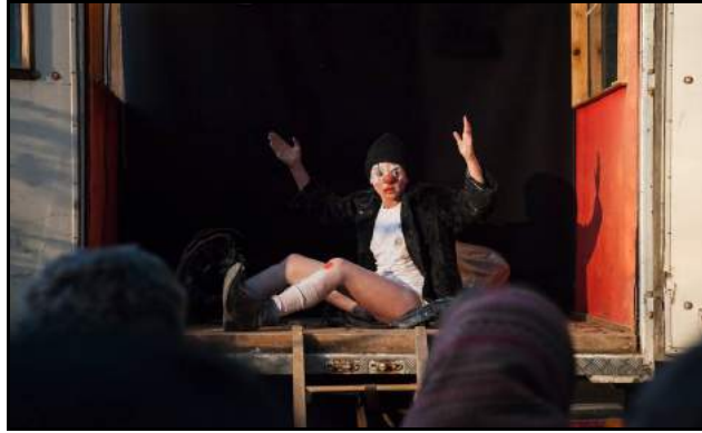
PETROLE, Clown jeté sur la voie publique - Le Quillo - Aout 2017